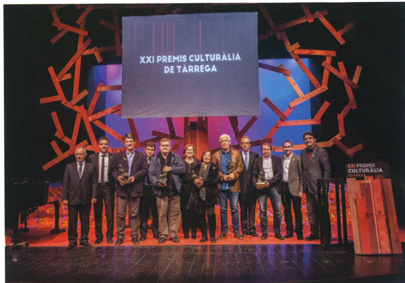
Els premiats amb el seu guardó i els encarregats de lliurar-los